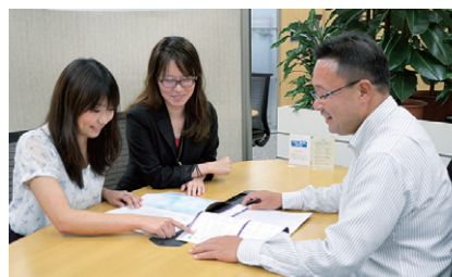
お客さまの就労や業務改善に役立つよう、データの活用アイデアを出し合ったりテキスト分析の切り口を共有したりと、日々分析精度を高めている。

自社の就労や業務の改善にあたって、課題の抽出や解決にお悩みの企業さまはお気軽にお問い合わせください。